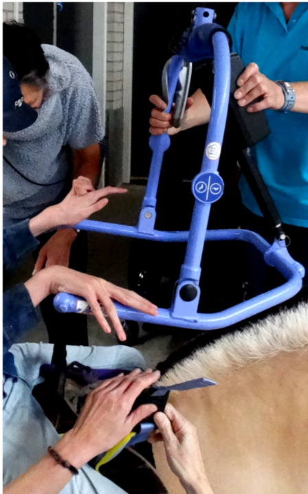
De tillift maakt paardrijden voor iedereen die enige rompbalans heeft bereikbaar.